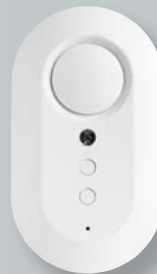
Hineinhören und -sprechen aus der Ferne