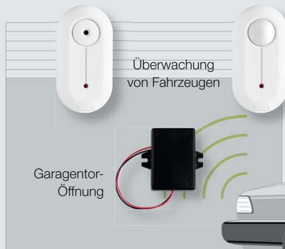
Überwachung von Fahrzeugen