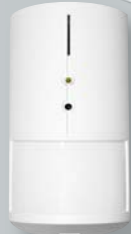
Bewegung und Kamera