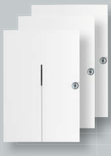
Funkausgangs- schalter (für Heizung, Licht, Rollläden, ...)